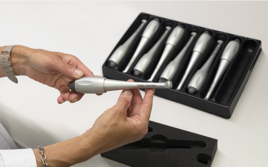
Verpackungsdienst, Anthogyr Sallanches