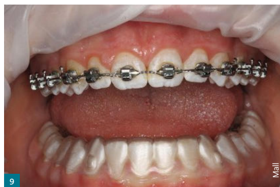
Abb. 9 Mit Alignern lassen sich alle Arten der klassischen Behandlungsmöglichkeiten optimal erweitern.