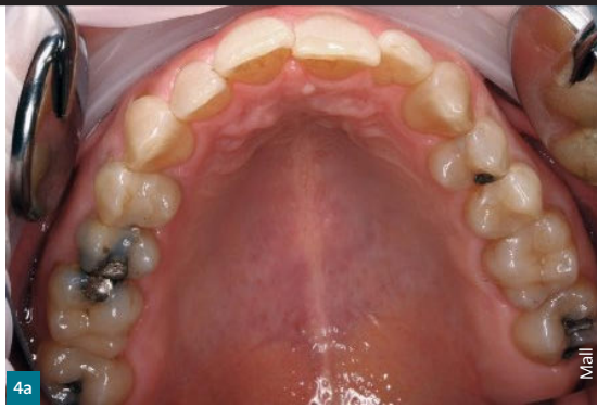
Abb. 4a Engstand zweiten Grades bei einem adulten Patienten ...