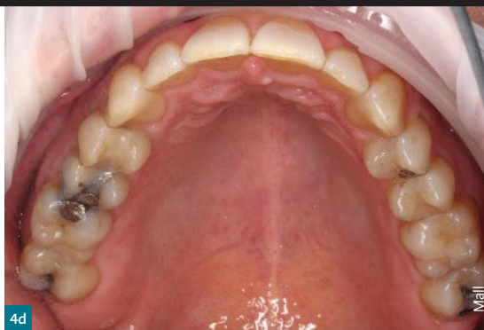
Abb. 4c & 4d Endresultat der ausgeformten Bögen in Ober- und Unterkiefer nach konsequenter Trageweise über einen Zeitraum von zehn Monaten bei insgesamt 20 Schienen