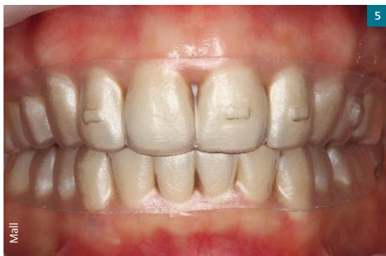
Abb. 7 Der Patient muss kaum ästhetische Einschränkungen in Kauf nehmen.

Abb. 6 Auch Fälle, die sonst den klassischen kieferorthopädischen Gerätschaften vorbehalten sind, lassen sich mit Alignern lösen und in den ClearCorrect Treatment-Plan implementieren, hier die Mobilisation des retinierten Zahns 13.