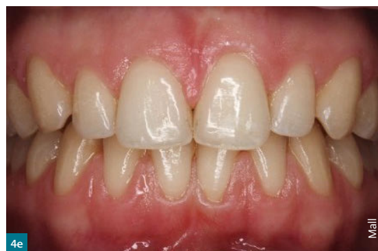
Abb. 4e Gut einge- stellte Mittellinie

Die derzeitigen Schienen halten bei täglicher Belastung schon fast ein Jahr. Weitere interessante Möglichkeiten ergeben sich in der PAR-Therapie. Man kann die Kraft der Aligner herunterregulieren und so aufgefächerte Fronten nach erfolgreich abgeschlossener PAR-Therapie wieder zurückführen und auch langfristig stabilisieren.