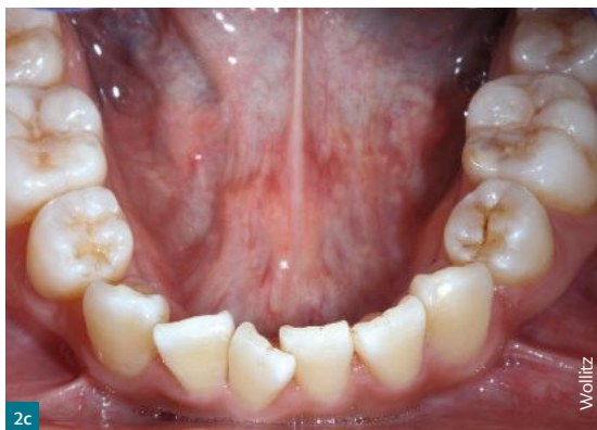
Abb. 2f Okklusale Ansicht des Oberkiefers nach der Alignertherapie