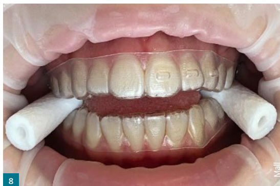
Abb. 8 Mit sogenannten Wedgets/Chewies müssen die Aligner auf gute Passung kontrolliert werden.

MALL: Ich wünsche mir mehr Einflussnahme, auch wenn die Kommunikation mit dem verantwortlichen Techniker im Workflow sehr gut ist. Bei der Planung am Bildschirm würde ich gerne mehr direkt entscheiden dürfen. Insgesamt betrachte ich die Alignertherapie als modernes Behandlungskonzept mit enormen Nutzen für Zahnarzt und Patient. ■