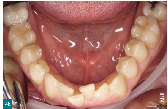
Abb. 4b ...mit dem Wunsch eines wohl ausgeformten Zahnbogens aus ästhetischen und parodontal-prophylaktischen Gründen

Patientenunterlagen und eigenen Vorgaben plant. Standardmäßig empfiehlt ClearCorrect – sofern nötig – die approximale Schmelzreduktion sowie das Anbringen von Attachments, den erwähnten Engers, die den Kraftangriff auf den Zahn vorwiegend bei Rotationsbewegungen erhöht. Wer diese Option nicht wünscht, teilt das ClearCorrect im Antragsformular mit. Die Therapieverantwortung liegt aber ganz klar stets beim Behandler. Wir korrigieren den Behandlungsplan zum Beispiel sehr häufig. Schließlich hat der Techniker keinen Patientenkontakt. Hilfreich für Neueinsteiger ist sicherlich das Treatment-Set-up, eine interaktive 3-D-Vorschau der Behandlung, die auch an den Patienten zu Demonstrationszwecken weitergesendet werden kann. Sie enthält das vorhergesagte Endergebnis und den Fortschritt bei jedem Schritt einschließlich empfohlener Verfahren wie ASR und das Kleben von Attachments.