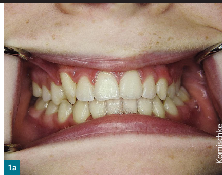
Abb. 1a & 1b Frontansicht vor und nach der Behandlung

Abb. 1a bis 1f Behandlung eines linksseitigen Kreuzbisses bei einer geringfügigen Rückenlage des Unterkiefers mit 20 Schienenpaaren