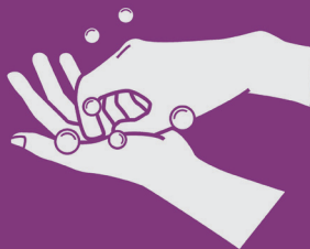
5) Esfregue as unhas