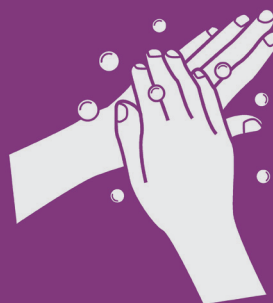
6) Esfregue o dorso das mãos