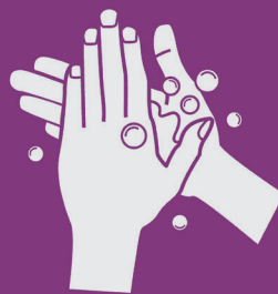
3) Esfregue as palmas