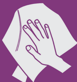
10) Seque as mãos