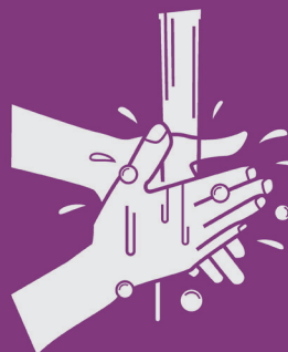
9) Enxague as mãos