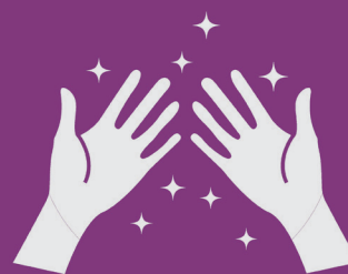
12) Mãos limpas

Saiba mais em www.dentistaspelaude.com.br