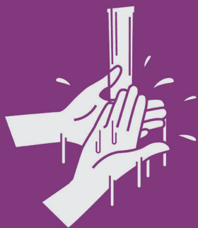
1) Molhe as mãos