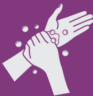
8) Esfregue os punhos