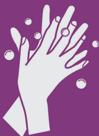
4) Esfregue os dedos