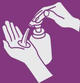
2) Aplique sabão