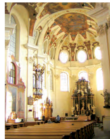
Jan Sokol – self-published work, CC BY-SA 3.0