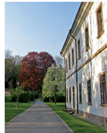
Daniel Baránek, CC BY-SA 3.0