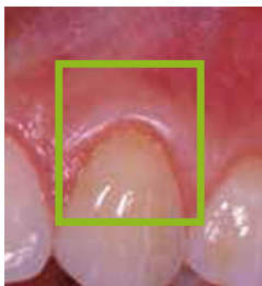
8 Monate nach der Behandlung mit Straumann® Emdogain® Zahnhsal völlig bedeckt