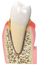
3. Schwere Zahnfleischentzündung und Entzündung des Zahnhalteapparats (Parodontitis)