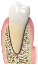
1. Gesundes Zahnfleisch und Zahnhalteapparat