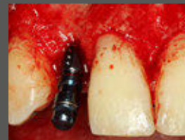
Mit Loxim™ inseriertes Implantat