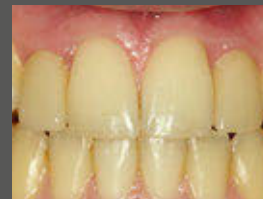
Patient nach der erfolgreichen Behandlung mit Straumann® BLT 2,9 mm Implantaten