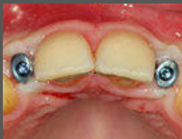
Platzierung der Einheitschraube nach 9 Wochen Einheilzeit