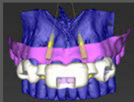
Planung mit coDiagnostiX®