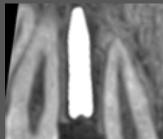
Postoperative DVT-Aufnahme, die die Positionierung des Implantats auf der rechten Seite zeigt (Ultraniedrigdosis-Protokoll)