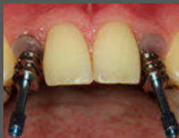
Abschliessende Abformung mit individualisierten Abformpfosten