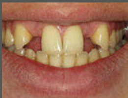
Nichtanlage bleibender Zähne bei einem Patienten

Das Straumann® BLT Ø 2,9 mm wurde für ästhetisch überzeugende Ergebnisse und eine nachhaltige, zuverlässige Behandlung mit reduzierter Invasivität bei jüngeren Patienten mit Nichtanlage von bleibenden Zähnen entwickelt.