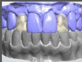
Anatomische Rekonstruktion der provisorischen Krone