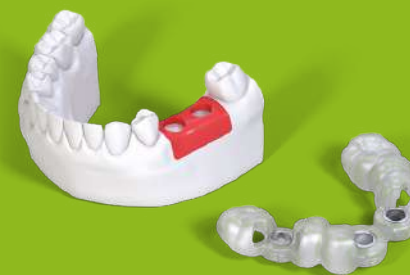
P series printers

Control total del proceso de producción, creando una solución completa desde la impresión hasta el postprocesamiento.