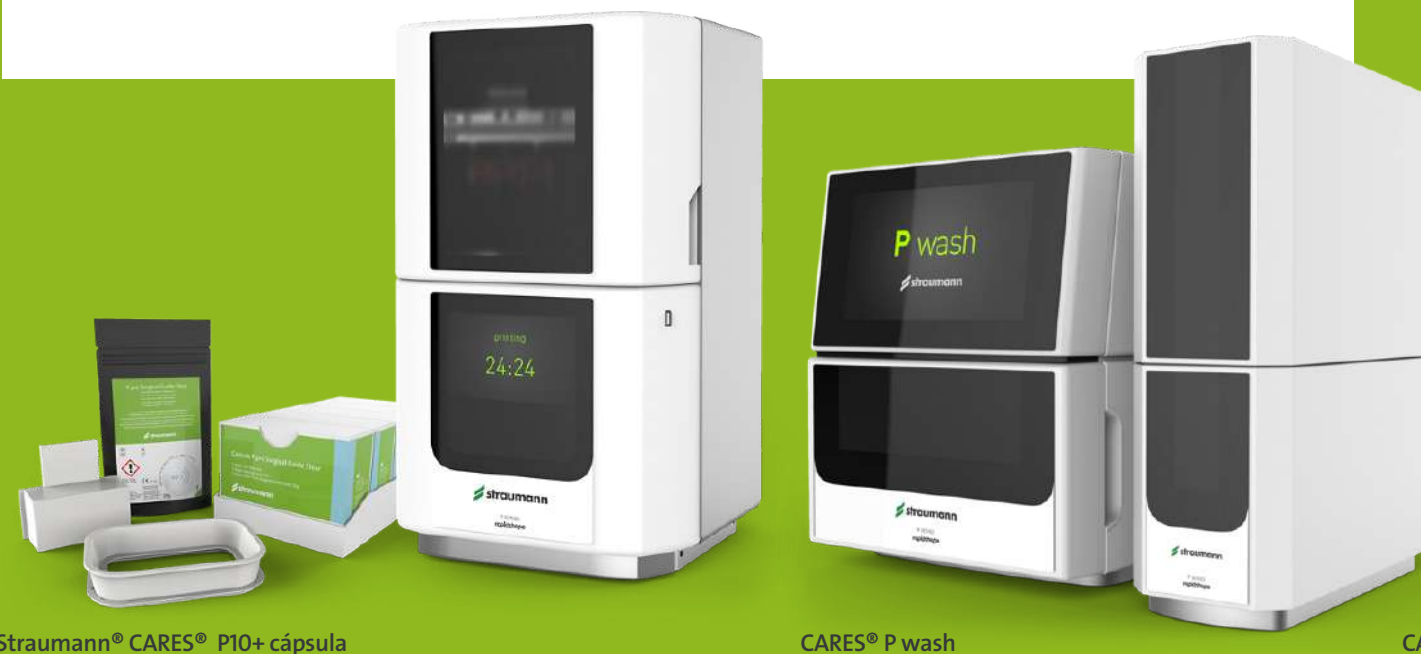
Straumann® CARES® P10+ cápsula

Imprime en cada momento los productos dentales que necesites sin depender de los plazos de entrega de terceros. CARES® P Series es una solución muy completa para tu clínica, ya que abarca desde la impresión de los productos hasta su lavado y acabado final . Seguro y fiable, ofrece productos de la más alta calidad con el respaldo de Straumann y de su servicio de postventa. Además, es muy sencillo de utilizar y dispone de una completa integración con todo el flujo de trabajo CARES® y con CoDiagnostiX® .