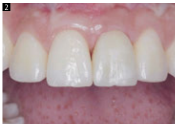
2 Resultado final