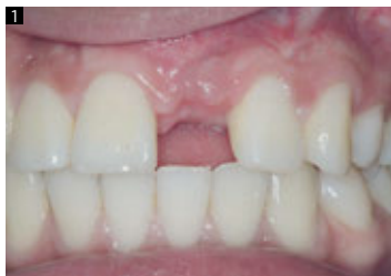
1 Antes de la colocación del implante