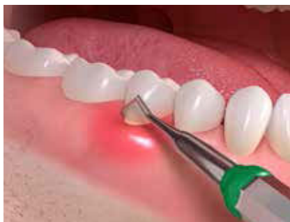
Élimination de la plaque et du tartre

La première étape consiste à nettoyer soigneusement la dent concernée pour éliminer les bactéries à l'origine de la maladie. Votre dentiste vous expliquera comment nettoyer vos dents de manière optimale, y compris les endroits difficiles d'accès comme les espaces interdentaires.