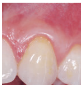
8 mois après le traitement par Straumann® Emdogain®