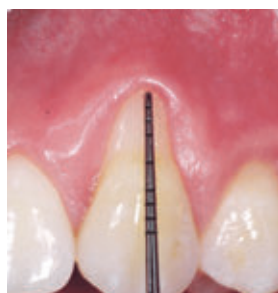
Avant traitement avec Straumann® Emdogain®