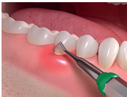
Rimozione della placca e del tartaro

La prima fase consiste in una pulizia professionale dei denti colpiti, per rimuovere i batteri che hanno causato l'insorgere della malattia. Ti verrà spiegato come lavare i denti nel modo ottimale, anche nelle aree difficili da raggiungere, come gli spazi interdentali.