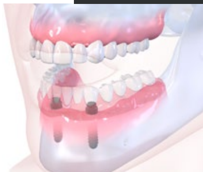
Sistema de retenção Straumann® Novaloc com implantes regulares