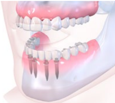
Sistema Straumann® Mini Implant

Você pode optar por dentes fixos em implantes, que você mesmo remove para a limpeza. Existem diferentes tipos de implantes nos quais os seus novos dentes podem ser fixados, e diferentes sistemas de fixação com um clique para colocar os dentes nos implantes.