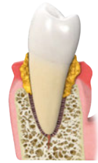
4. Inflamação e atrofia maciças do periodonto