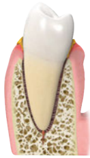
2. Gengivite leve causada pela formação de placa bacteriana e tártaro