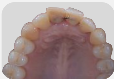
Situação inicial mostrando o dente #21 ferulizado.