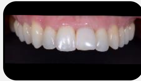
Coroa provisória após o condicionamento gengival.