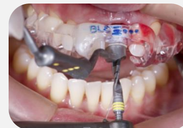
Sequência de fresas para instalação do implante Straumann® BLC 3.75.