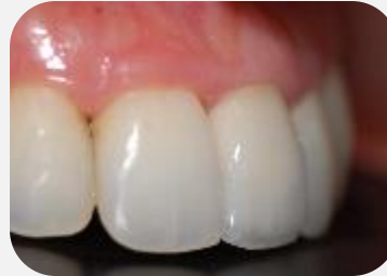
Aspecto final da coroa definitiva em vista lateral.