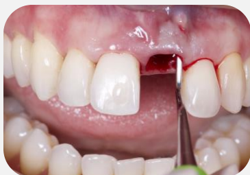
Tunelização para enxerto de tecido conjuntivo.