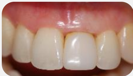
Aspecto da coroa provisória antes do condicionamento gengival.