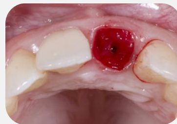
Vista oclusal após exodontia minimamente invasiva.