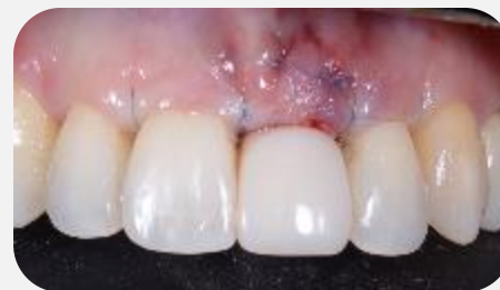
Vista oclusal após incisão na crista mucoperiosteal.