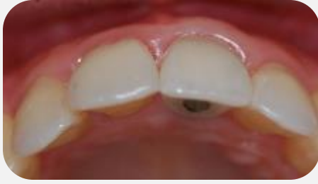
Volume do rebordo alveolar após enxerto de conjuntivo e emergência protética com a posição ideal do implante.