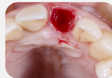
Perfuração com a broca Straumann de 1,6 mm e curetagem do tecido de granulação.