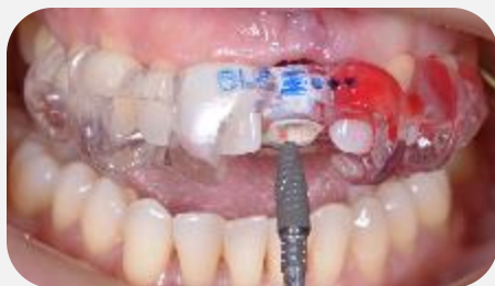
Inserção guiada do implante Straumann® BLC 3.75x10 com torque de 50 N.cm.