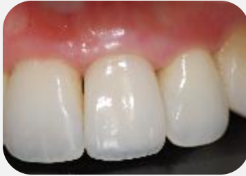
Aspecto final da coroa definitiva.