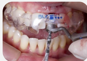
Cirurgia guiada para colocação imediata de implante Straumann® BLC.