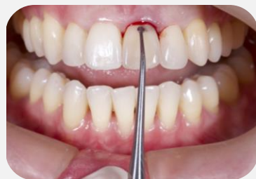
Aspecto inicial em vista frontal.