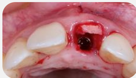
Implante e enxerto de tecido conjuntivo posicionados.