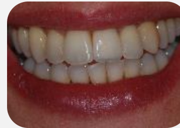
Sorriso da paciente após a reabilitação.