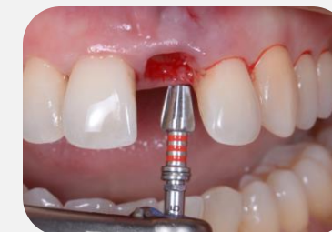
Piloto para o implante Straumann® BLC 3.75.