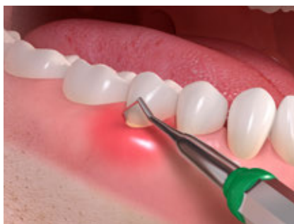
Élimination de la plaque et du tartre

La première étape consiste à nettoyer soigneusement la dent concernée pour éliminer les bactéries à l'origine de la maladie. Votre dentiste vous expliquera comment nettoyer vos dents de manière optimale, y compris les endroits difficiles d'accès comme les espaces interdentaires.