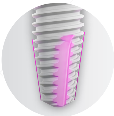
Apicalmente conico con camere con scanalature.