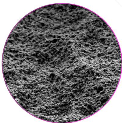
Immagine rappresentativa della superficie implantare - ingrandimento al microscopio elettronico a scansione (SEM) di 5000x.