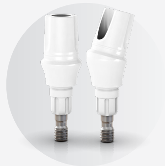
Moncone Zi CR