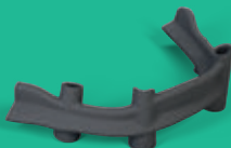
Barra fissa base