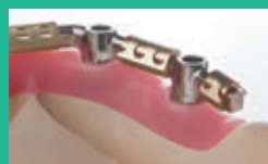
Barra Dolder® forma a U