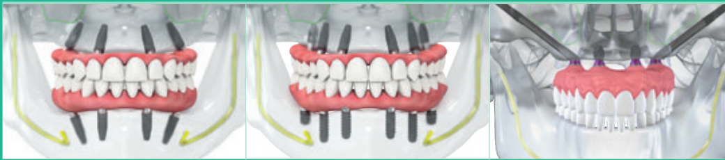
Straumann® Pro Arch con impianti BLT, BLX e TLX