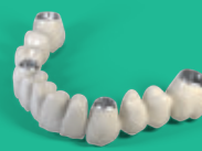
Ponte ZrO 2 /PEEK/PMMA